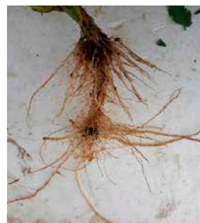
Sviluppo radicale COLONIZER g 200