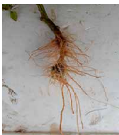
Sviluppo radicale CONTROLLO